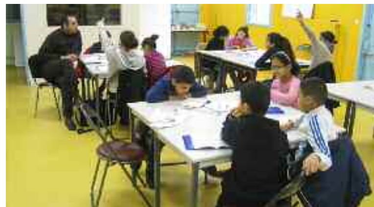
L'aide à la scolarité dans le local remis à neuf et occupé par l'association.

Une réflexion autour du projet social du Mas Chaque mercredi matin, les habitants peuvent venir au Monde réel et participer à la consultation sur le futur du Mas du Taureau. L'association a été mandatée par la Ville pour recueillir la parole des habitants. "Il ne s'agit pas d'un travail de sociologie, précise la directrice. Nous sommes là pour que les habitants puissent s'exprimer et être entendus dans cette vaste opération. On s'engage à développer un espace de parole libre sur cette question". Ainsi, un